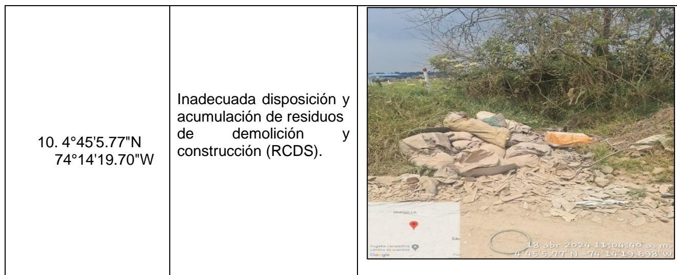
Tabla 1. Hallazgos recorrido vereda El Cocli.

C.P. 250020 Tel. +57(1) 823 40 70 823 40 71 / 823 40 73 Fax. +57(1) 825 76 20 Dir. Cra. 14 No. 13-05