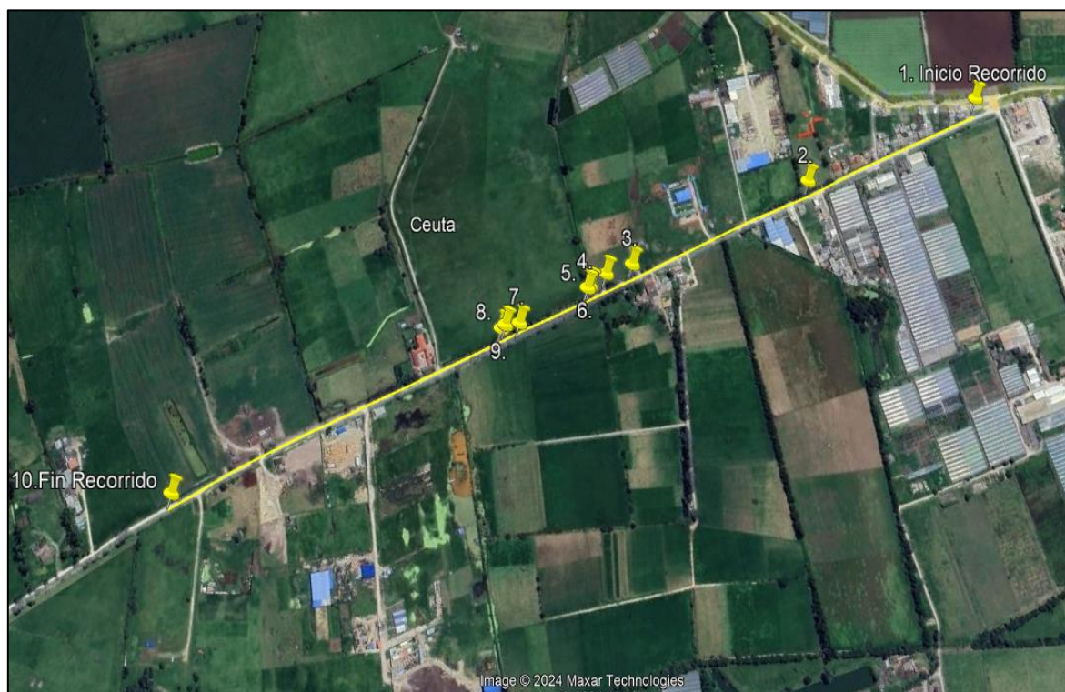
Ilustración 1. Recorrido verificación ambiental -Vereda El Coclí

Se realizó recorrido de control y vigilancia de los componentes ambientales en áreas rurales del municipio de Funza, vereda El Coclí, el día 18 de abril de 2024, desde las Coordenadas 4°44'34.55"N - 74°13'38.73"W hasta las coordenadas 4°45'5.77"N - 74°14'19.70"W (ver ilustración 1. Ruta amarilla), con el fin de verificar las condiciones ambientales, identificar posibles afectaciones a los recursos naturales y realizar las acciones de prevención correspondientes.